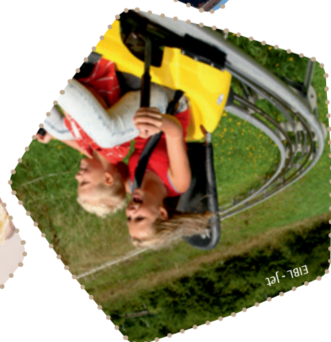
EIBL - Jet