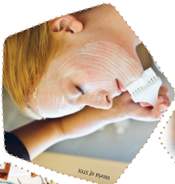
World of styx

Stand 2016, Änderungen vorbehalten Eine Initiative der Partnerbetriebe