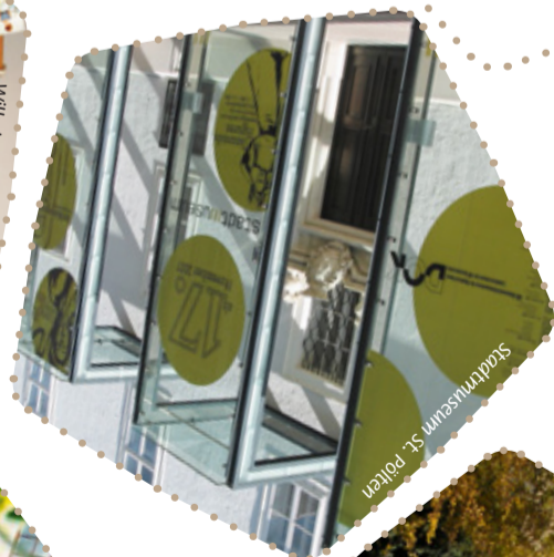
StadtIIIuseum St. Pölten