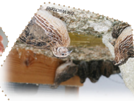
„Es kommt nicht auf die Größe an.“ Die Wachtelei